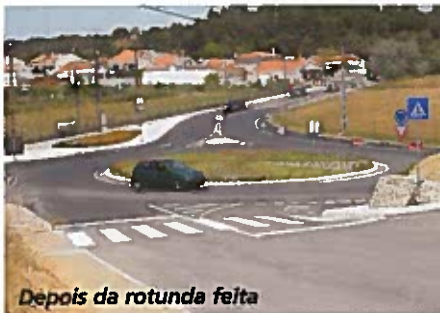
Depois da rotunda feita