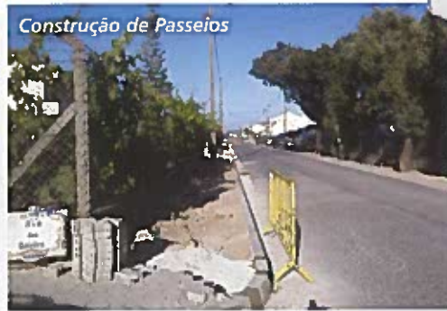
Construção de Passeios