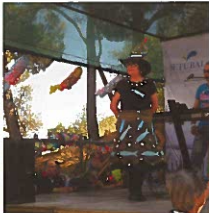
Eleição Miss Piquenício