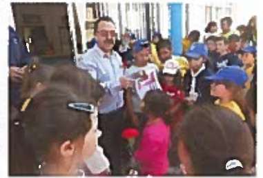
Prova de Atletismo - Crianças