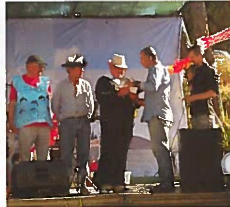
Eleição Mister Piquenício

- Devido às eleições autárquicas, a Junta de Freguesia irá antecipar para Setembro, o seu já tradicional almoço de confraternização e convívio para a população sénior, no sentido de lhe proporcionar um dia diferente, cheio de alegria e boa disposição.