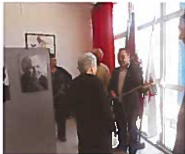
A entrega de uma fotografia a cada participante da exposição

ROSTOS DE GENTE COM PASSADO BEM PRESENTE QUE O TEMPO NÃO APAGOU APENAS MUDOU! GENTE, QUE TRABALHOU DIA A DIA LAVRANDO ESTA TERRA COM SABOR A SAL E CHEIRO A MAREJIA ROSTOS HUMILDES, FUNDAMENTO DAS NOSSAS RAIZES, FRAGMENTOS DA HISTÓRIA PRESENTE ESTA, É A NOSSA GENTE!