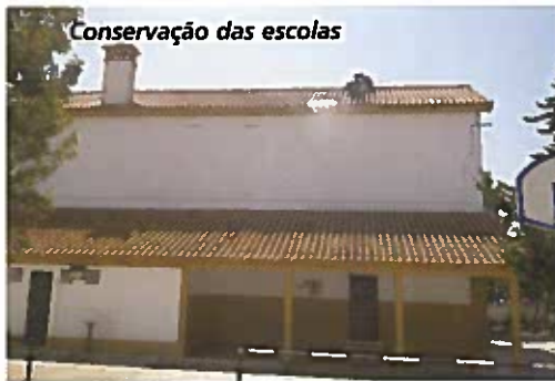
Conservação das escolas