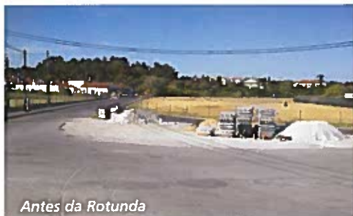
Antes da Rotunda

Com o esforço financeiro da Câmara Municipal e da Junta de Freguesia as populações, foram finalmente contempladas com estes investimentos, que veio em muito melhorar a qualidade de vida na Freguesia.