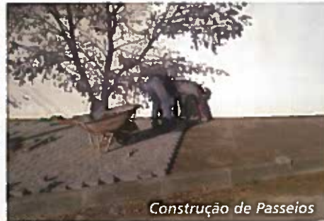
Construção de Passeios