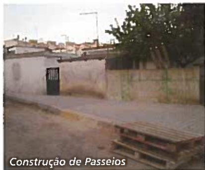
Construção de Passeios